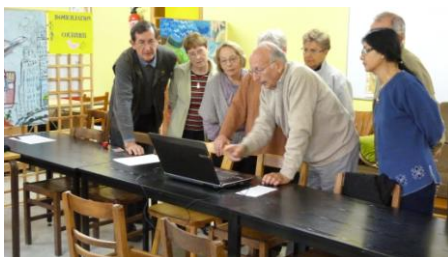
Et passe aux travaux pratiques

Continuons d'approfondir la connaissance de nos publics pour mieux répondre à leurs attentes