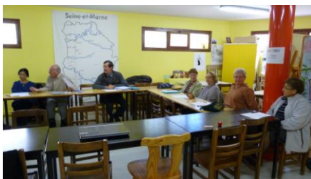
L'équipe Courrier se concerta