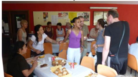
Et son traditionnel loto très suivi