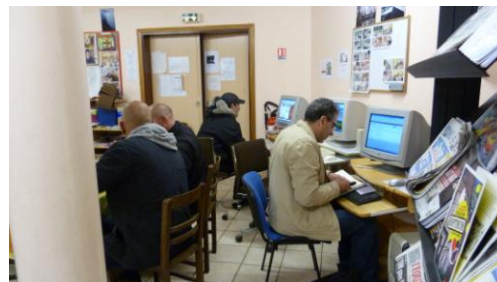
Consultation Internet à l'accueil